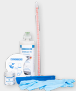
Kit de réparation de bandes transporteuses