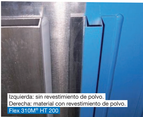
Izquierda: sin revestimiento de polvo. Derecha: material con revestimiento de polvo. Flex 310M® HT 200