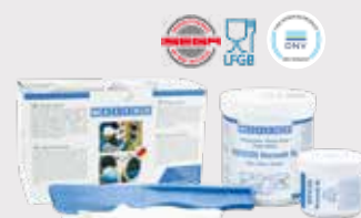
WEICON 耐磨型陶瓷修补剂 BL

▶ 0.2kg 10054394 ▶ 0.5kg 10000093 ▶ 2.0kg 10005233