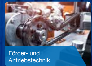
Förder- und Antriebstechnik