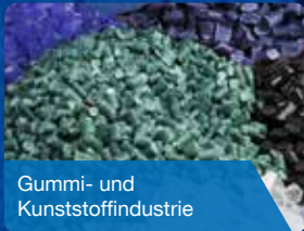
Gummi- und Kunststoffindustrie