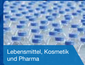
Lebensmittel, Kosmetik und Pharma