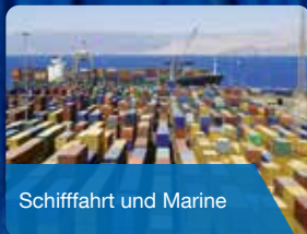
Schifffahrt und Marine