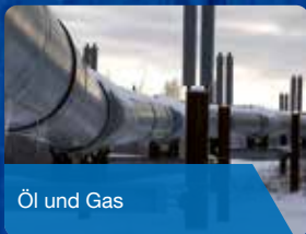
Öl und Gas