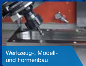
Werkzeug-, Modell- und Formenbau