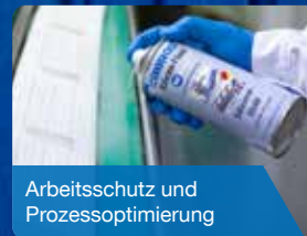
Arbeitsschutz und Prozessoptimierung