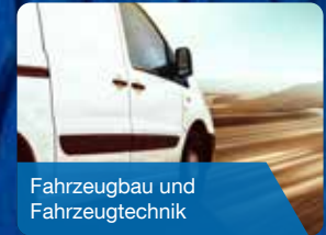
Fahrzeugaufbau und Fahrzeugtechnik