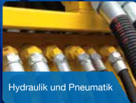
Hydraulik und Pneumatik