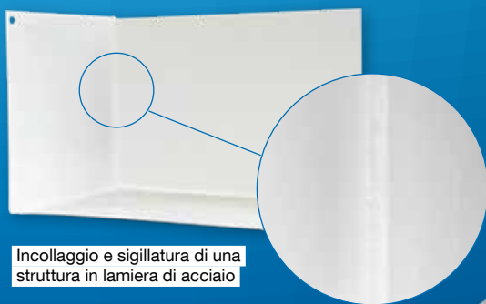
Incollaggio e sigillatura di una struttura in lamiera di acciaio