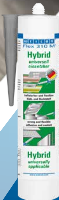
310 ml 10067875 cartuccia

L'adesivo e il sigillante possono essere utilizzati in settori industriali come la costruzione di contenitori e apparecchi, la costruzione di carrozzerie, contenitori e veicoli, nella costruzione di tubazioni e valvole, nell'industria energetica ed elettrica, nella tecnologia di isolamento nonché nella tecnologia delle materie plastiche. Inoltre, WEICON Flex 310 M Hybrid ha un elevato livello di resistenza alla muffa ed è compatibile con la pietra naturale. Ciò significa che il sigillante può essere utilizzato in molti settori, come nel settore sanitario o in quello edile.