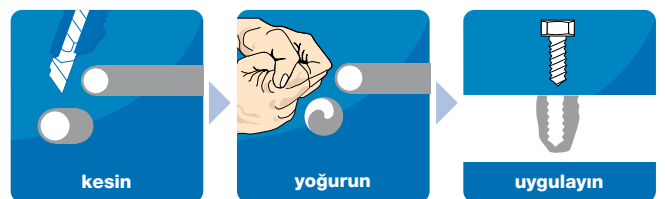
Araba Port bagaj tamirati