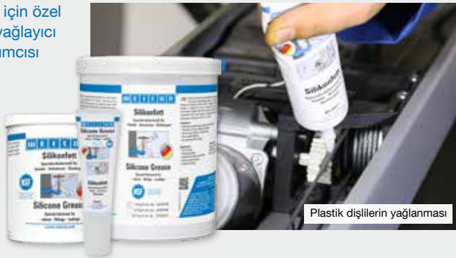
Plastik dişlilerin yağlanması

1 BAM tarafından test edildi ve emniyet tekniği açısından değerlendirildi - bkz. M 034-1 broşürü BG RCI'nin "metalik olmayan malzemelerin Oksijenle kullanımı" (DGUV Bilgileri 213-075).