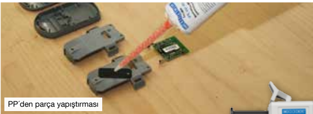
PP'den parça yapıştırması