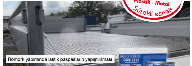
Römork yapımında lastik paspasların yapıştırılması

Güçlü yapıştırma Kontakt Yapıştırıcı Plastik - Metal Sürekli esnek