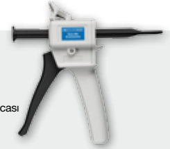
Easy-Mix El Tabancası 10653050