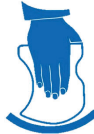
Application et lissage d'un coude de tuyauterie