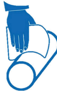
Application et démontage d'un arbre