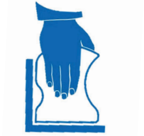
Démontage et lissage d'un joint de raccordement