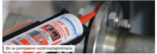
Bir ısı pompasının sızdırmazlaştırılması