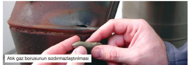
Atık gaz borusunun sızdırmazlaştırılması