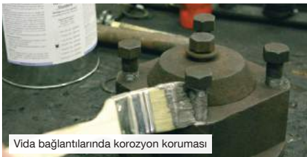
Vida bağlantılarında korozyon koruması

Korozyona, sıkışmaya ve aşınmaya, oksidasyona, pas ve elektrolit reaksiyonlara („Soğuk kaynak“) karşı etkili koruma sağlar.