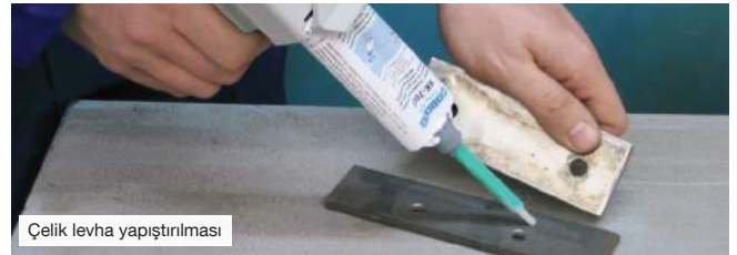
Çelik levha yapıştırılması