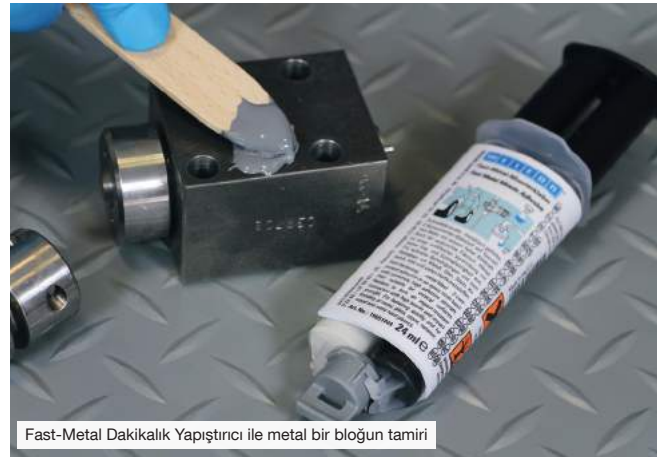
Fast-Metal Dakikalık Yapıştırıcı ile metal bir bloğun tamiri