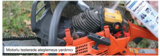
Motorlu testerede ateşlemeye yardımcı