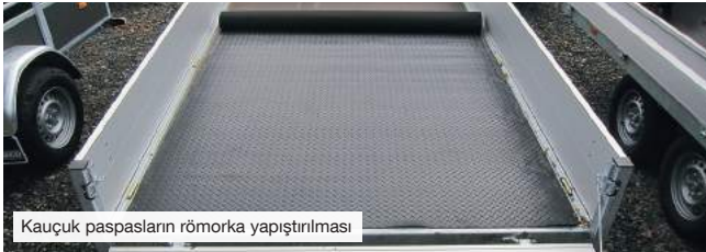
Kauçuk paspasların römorka yapıştırılması