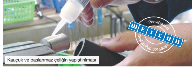
Kauçuk ve paslanmaz çeliğin yapıştırılması