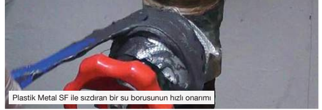
Plastik Metal SF ile sızdıran bir su borusunun hızlı onarımı