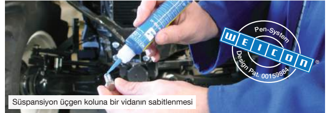
Süspansiyon üçgen koluna bir vidanın sabitlenmesi

Sertleşme sonrası kimyasallara, solventlere ve -60°C ile + 150°C arasında sıcaklıklara karşı dirençli, titreşime ve darbeye dayanıklı bir yapıştırıcı bağlantı meydana gelir.