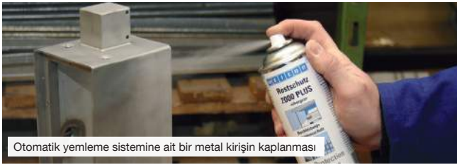
Otomatik yemleme sistemine ait bir metal kirişin kaplanması