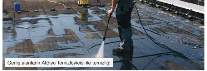
Geniş alanların Atölye Temizleyicisi ile temizliği

Yüzeylerin bakımı ve korunması, temizlenme ve yağdan arındırması, yağlaması, çözme ve ayırma işleri için kullanılmaları ile günlük çalışma işlerinin vazgeçilmez bir parçasıdır.