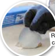
Reparation d'un auvent de caravane GMK 2410

Colles contact pour coller du caoutchouc et des métaux .