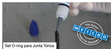
Set O-ring para Junta Tórica

WEICON Contact son adhesivos de cianoacrilato exentos de diluyentes. Unen en segundos una gran variedad de materiales consigo mismo o entre ellos, p. ej. metal, vidrio, madera, plástico, cerámica, piel y goma.